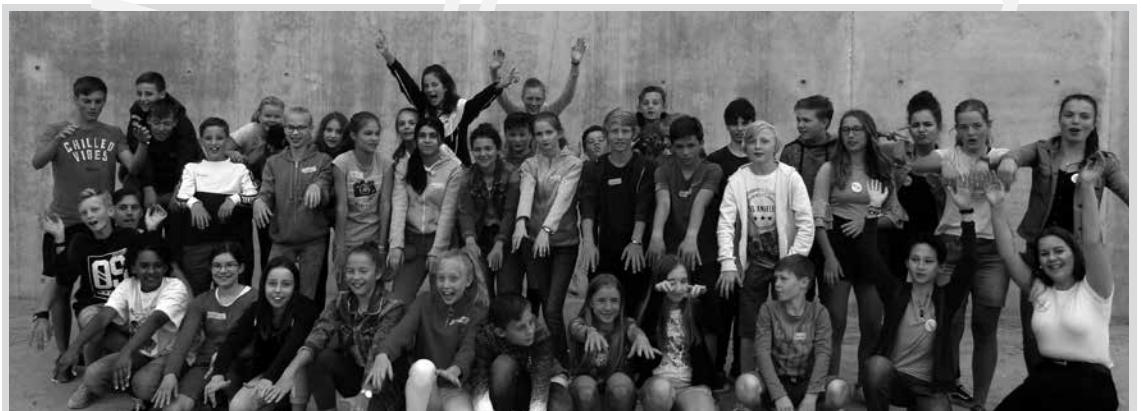
Unsere neuen Konfis: 35 Konfirmand*innen sind im Juni in ihre Konfizeit gestartet.

Vom 1. bis 23. Dezember gestalten wieder 23 Menschen/Familien ein Türchen des Lebendigen Adventskalenders im Rieselfeld. Jeweils um 17.30 Uhr treffen sich Kinder und Erwachsene, Freunde und Fremde vor dem entsprechenden Haus. Es wird eine Geschichte zum Advent vorgelesen und/oder gemeinsam Adventslieder gesungen, ein Gedicht vorgetragen ... Alle Termine können Sie über den ökumenischen Adventsbrief erfahren. Machen Sie mit! Tragen Sie sich bis Mitte November ein! Die Listen liegen ab Mitte Oktober im Kirchenladen aus.