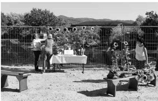
Baustellen-Gottesdienst im Juni 2018