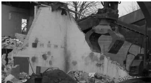
Abrissfoto vom Januar 2018

Bereits seit über einem Jahr ist die Johannesgemeinde nun Gast in den Kirchen- und Gemeinderäumen von St. Gallus. Dass man dennoch heute vom neuen Gebäude erst den Rohbau sieht, hat mehrere Gründe. Nachdem der Architektenwettbewerb noch von einem 2-gruppigen Kindergarten ausging, hat sich die Bedarfsprognose im Laufe der Planung zuerst auf einen dreigruppigen, dann sogar auf eine viergruppige Einrichtung erhöht. Daran musste der fertige Entwurf jeweils angepasst werden. Als dann auf die Ausschreibung der Rohbauarbeiten kein einziges Angebot abgegeben wurde, verzögerte sich der Baubeginn entsprechend. Erst im Februar konnte mit den Rohbau- und Erdarbeiten begonnen werden, die zudem noch mit unerwartet schwierigem Baugrund zu kämpfen hatten. Trotz aller Hindernisse soll aber der Fertigstellungstermin im Sommer 2019 eingehalten werden.