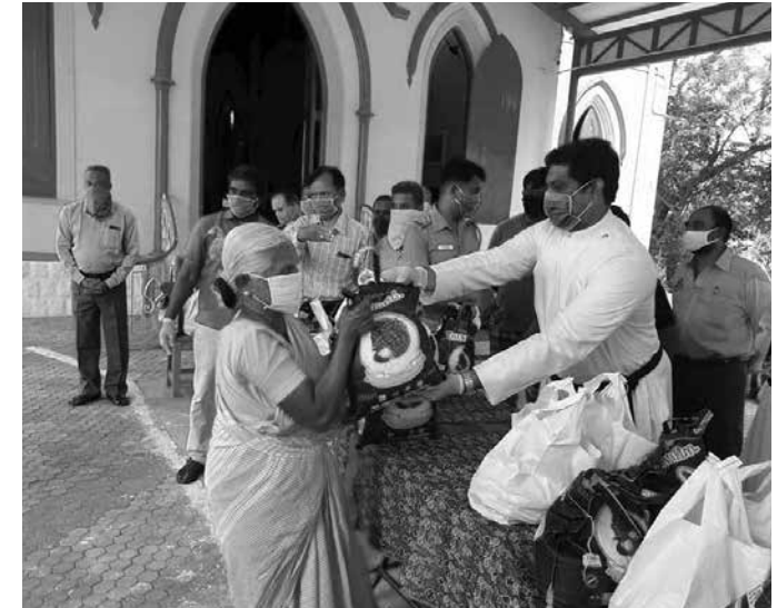
Verteilen von Lebensmittel an Bedürftige in Südindien © CSI

Ein Hinweis zur Eröffnung: Aufgrund der coronabedingten Auflagen darf die Eröffnung – völlig anders als erhofft – leider nicht im großen Kreis gefeiert werden. Bitte haben Sie Verständnis, dass nur geladene Gäste teilnehmen können. Wir hoffen sehr, dass es gerade im Predigtbezirk Lukas noch manche Gelegenheiten geben wird, Haus Lukas und die Menschen darin näher kennenzulernen!