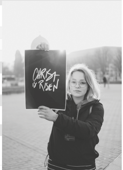
„Christus ist auferstanden“

Bitte schauen Sie auch auf unserer Homepage vorbei. Auf www.ekifrei-suedwest.de finden Sie immer die aller neuesten Infos.