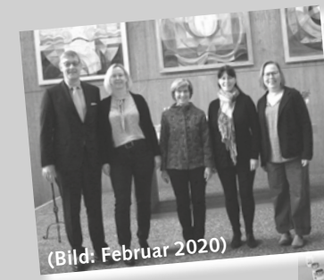
(Bild: Februar 2020)