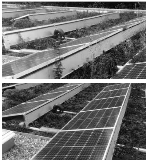
PV-Anlage vor (oben) und nach der Säuberungsaktion

Anfang 2020 bezogen wir nach dem Umbau die neuen Gemeinderäume (energetisch auf aktuellem Stand!). Wegen Corona gab es kein offizielles Einweihungsfest, aber am 3. Juli diesen Jahres konnten wir wieder ein Gemeindefest feiern und damit die neuen Räume erstmals umfassend nutzen; entsprechend den GRÜNER-GOCKEL-Zielen gab es zum Mittagessen kein Fleisch, sondern vegetarische Maultaschen und Quiche.