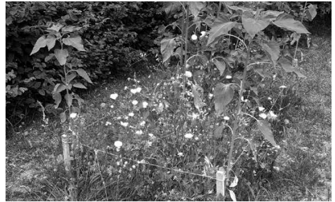
Drei Monate später.

Hierfür besorgten wir uns aus unterschiedlichen Quellen Saatgut für die Blühwiese, und zwar von Manufactum, aus dem Baumarkt und vom Bauhof Merzhausen. Letzterer hatte bereits an mehreren Stellen im Ort Blühwiesen angelegt.