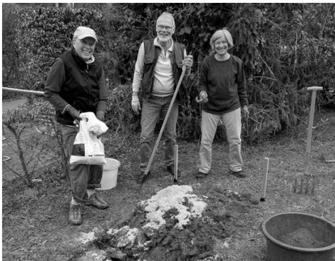
Das Beet wird präpariert.

Wir hörten, dass das auch von anderen Predigtbezirken versucht wurde, dass dort die Ergebnisse aber trotz professioneller Beauftragung nicht positiv waren. Wir starteten daher in diesem Frühjahr zunächst auf einem kleinen Stück mit einem Test, um zu prüfen, was erfolgreich sein kann: Wir gruben dazu zwei Quadratmeter Rasen ab, lockerten die Erde und suchten penibel alle Unkrautwurzeln heraus. Um den Boden abzumagern, mischten wir die obere Schicht mit Sand. Damit legten wir die Grundlage für die Aussaat.